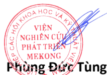
Phùng Đức Tùng